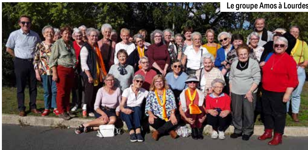
Le groupe Amos à Lourdes.

C'est dans ce lieu privilégié qu'on peut enfin parler librement de la personne disparue, des mois, voire des années après son décès, alors que personne n'en parle plus à l'extérieur. On peut parler sans être jugé. Ils sont passés par là, ils savent, ils comprennent, ils traversent ou ont traversé les mêmes épreuves. C'est un lieu