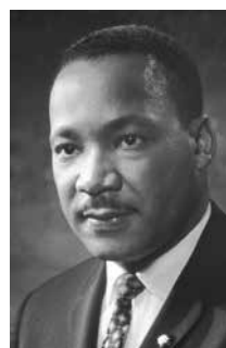
Martin Luther King.